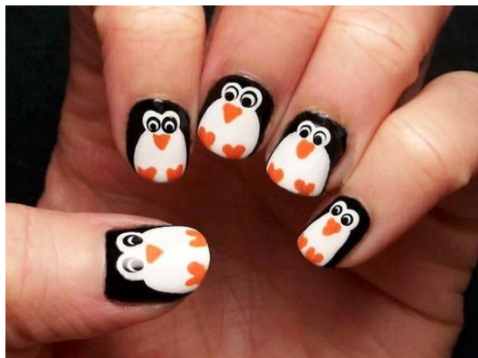
Fodor Noémi 11.D